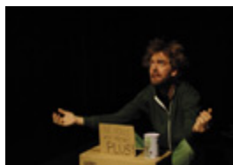
Agrandir la photo